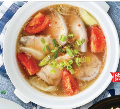
CANH CHUA CÁ BỚP (LON) Sweet & Sour Cobia Fish Broth