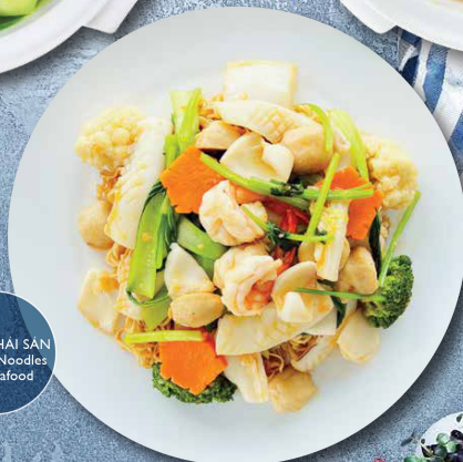
MÌ XÀO HẢI SẢN Stir-fried Noodles with Seafood