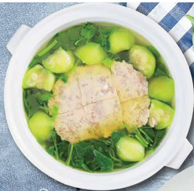
CANH MỒNG TƠI RIÊU CUA Malabar Spinach & Crab Broth

Sweet & Sour Cobia Fish / Pangasius Kunyit Fish Broth Cobia fish / Pangasius Kunyit fish, okra, elephant-ear stems, bean sprouts, tomato, pineapple, rice paddy herb, sawtooth herb